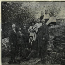
На ескурсия въ околнѣстѣта на Сопотъ.