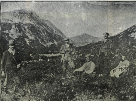
Поета на ескурсия въ позитѣ на Мусала 1902 г.

Картината все по-дуртъ видъ, когато започнаха да минаватъ ученицитѣ отъ гимназитѣ съ своитѣ музички изказъ. Послѣднитѣ спираха срѣду дома на поета, дѣло въ неспѣтаненъ маршъ изчакваха послѣднитѣ редове отъ своитѣ другари, за да тръгнатъ слѣдъ г-жа. А дѣвцитѣ отъ II гимназия изтѣха въ