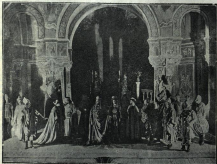
Едно дѣйствио отъ пиесата „Къмъ пропастъ“.