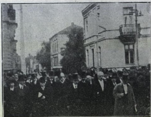
СОФИЯ Излизането на юбилея отъ класия

Нма да говоря за многостранната негова дйатност въ литературата. Върху това кометивни хора съ писали твърд много — и още повече ще пишавъ въ бъдеще — и на български, и на чужди езици. Всъки ученикъ въ България знае, че той е създаателъ на новобългарската литература въ всичкит и видове: лирика, епосъ, драма, романъ. Всъки знае, че дори въ тая прълковна възраст, скъпъ като, може да се каже, всички от най-даровитит по-млади български поети и писатели изхождат непосредствено отъ него, той все още продължава да заема първенстващо място въ родната литература. Многобройнит му книги могат да бъдат разглеждани като единъ чуденъ дневникъ на радостит и скърбит, които е прживялтъ българският народ пркъ последнит години. Нма пркъ той дълтъ периодъ нито една що-гождъ заслужаваща внимание случавъ на нашия живот, който да не е раздвокала струнит на неговата душа и да не е запазило за поколениата въ художественит форми на неговото искусство. Неговата литература е най-убавната история на чувствата и мислит на българския народ пркъ