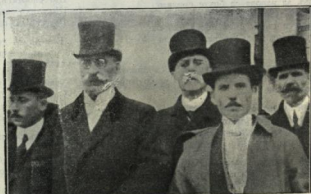
Прѣлъ Народния Театръ.

Чудесно съвно да творби идеали, Отъ твоята красота кога ше се омѣишъ? Сърчовице си ти, но ти кому си драго? Отъ всичкитъ бѣлаги най-скалоночно благо. . . Най-малко те скажигъ, ний даже те не знаемъ, И има ли народъ, кой себе си почита,