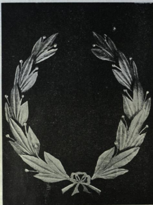
Сребрѣнъ вѣнецъ — даръ отъ македонската емиграция.

Отгиванитъ гранитъ бесѣда съ мене, Едваликъ висуахъ, — въ единъ горнина часъ: „Азъ самъ съмъ пакъ! Сѣ самъ! Скали катъ насъ