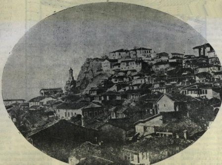
Пловдив — изгледъ.

Его въ силата на какви разбираня азъ броя днешното тържество за най-голямо правенство на българския национален дух и смътамъ скъпия поетъ за носител на най-голямото интелектуално и морално Саага, отъ които