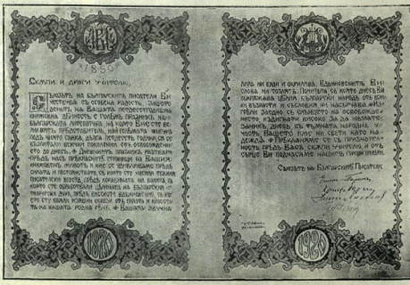
Отъ Сѣвмъ на българскитъ писатели.

И Въмъ, Господине Министре на Народната Просвѣта, които се дължи благодарнитъ почитъ за горния актъ, моята горна благодарностъ. Важно живо участие, изразено тѣя краснорѣчиво и словомъ и дѣломъ, ме трогна до глѣбинитъ на душата ми. Цѣнени изпитателното значение на признателноа като твоя, Вие и голъма разбирателностъ съизгнѣвате за неговия дългъ и тържественостъ. Благодарна.