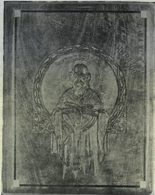
Отъ Министерството на Вътрешните Работи.