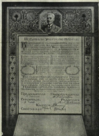
Х. К. Тосевъ

Отъ Съюза на учителитъ отъ прогимназитъ и срѣднитъ училища въ България.