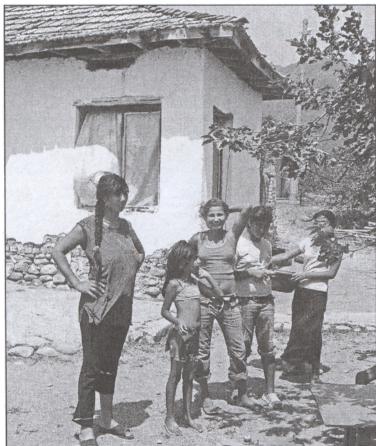
И днес традицията е жената да е с дълга коса

В някои цигански/ ромски групи все още е в сила правилото жената (особено омъжената) да не се показва с непокрити от кърпа коси. Така ги вижда в средата на XVII век Евлия Челеби „А жените на циганите слагат на главите си забрадки от червена чоха с пулове, които оставят да висят на гърбовете им – много некрасива работа е” (Челеби 1972: 57). В София в края на XIX век са: „Нечисти боси циганки с дълги коса-ци, покрити с цветни кърпи...” (Иречек 1899: 33). Десетилетие по-късно циганките „ходеха боси и дрипави, а забрадките им – от тъкани със силно