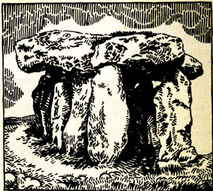
ДОЛМЕНЪ въ Ердюванъ (Морбианъ).

си направятъ и по-сгодни живѣлища. Тѣ избирали широки пещери, които затуляли съ голѣмъ камъкъ отпредъ, за да ги не нападатъ нощемъ звѣрове и да се запазятъ отъ студъ. Съ бронзовитѣ съчива можели вече сами да си дѣлбятъ живѣлища въ скалитѣ, тамъ, кждето имъ е най-сгодно. Тѣй се явило ново изкуство — строителството (архитектурата). И отпосле хората дѣлбали разни сгради въ скалитѣ. Египтенитѣ и индуситѣ изсичали въ планинитѣ голѣми храмове, а перситѣ — гробници на своитѣ царе.