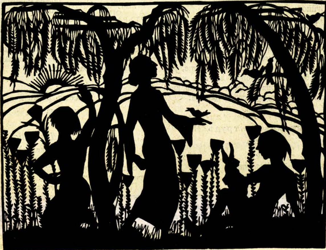
Весело пролѣтно слънце

Това стана по причини, които не зависятъ нито отъ издателството, нито отъ редакцията. Клишетата за дветѣ цвѣтни картини (приложението и тая на папката) сж поржчани въ чужбина и не сж още готови. Затова цвѣтното приложение на първа книга и папката ще се разпратятъ на предплатилитѣ абонати заедно съ втората книга, сжщо снабдена съ две черни приложения и едно цвѣтно, изработени въ чужбина.