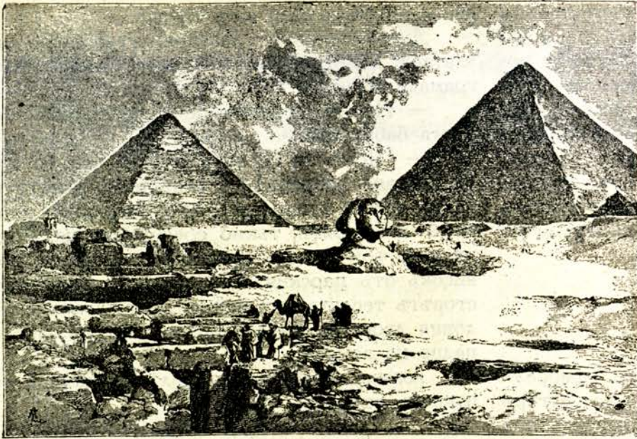
Пирамиди и сфинксъ при Гизе (Египетъ)

та гробници съ нѣколко стаи — като широки зимници, чиито стени били изсидани съ камъкъ; тия гробници се казвали ипогѣи (подземия).