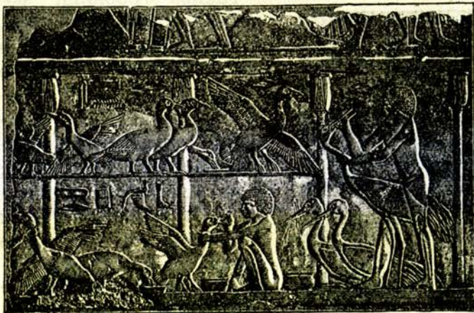
Деца хранятъ домашни птици

Но тоя народъ ималъ и ваятели (скульптори). Въ нѣкои гробници сж намѣрени каменни образи ( статуи ) на фараони (египетски царе), царици, писари, жреци (свещеници) и царедворци. Намѣрени сж и статуи отъ