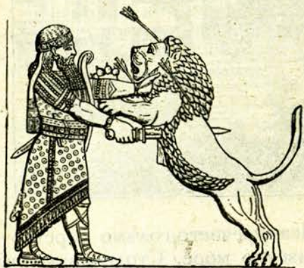
Асирійски царь убива лѣвъ

обагренитѣ съ глечъ и съединени тѣй, че образували наредени лѣвоуе, стрелци, цвѣтя и др.