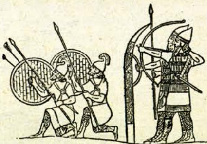
Асирійски войници — стрелци

Следъ асирійцитѣ въ Междуречието нахлулъ отъ изтокъ другъ народъ — персита. Тѣ покорили много народи и основали още по-голѣма държава. И тѣ имали свое изкуство: създали го, като заели по нѣщо отъ