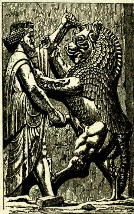
Персийски царь убива злия богъ Ариманъ

украшения. И предъ тия дворци имало голѣми крилати бикове, но съ глави на персийски царе и то съ рога. На нѣкои барелефи е изобразенъ царьтѣ, какъ вѣрви, съ дълъгъ жезълъ въ ржка, а задъ него — царедворцитѣ, които му пазятъ сѣнка съ особенъ видъ чадъръ; надъ главата му леги неговиятъ ангелъ-пазителъ, който му помага и го закриля. Другаде виждаме царя, какъ пробожда злия богъ Ариманъ, който е изваянъ като чудовище съ лѣвска глава, крила и птичи нозе.