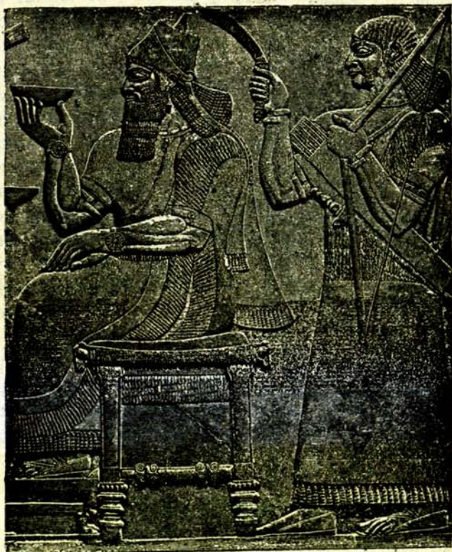
Асирійски царь на угощение

египтени и гърци и поизмѣнили халдейското изкуство. Въ тѣхнитѣ голѣми градове — Сузи, Пасаргадъ, Персеполь — се издигали висо-