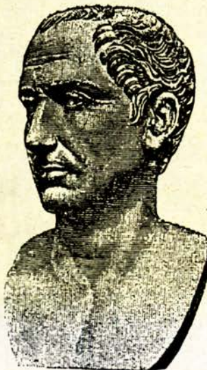
Бюстъ на Юлия Цезарь

и постлани съ камъни отъ римскитѣ войници. Останали сж и нѣкои паметни сгради, издигани за споменъ на важни събития: такива сж победнитѣ врати и паметнитѣ стълпове. Победната врата на императоръ Тита била издигната, за да се помни, че рименитѣ превзели Йерусалимъ. Тя е много хубава сграда, украсена съ изваяни образи. Такива врата се издигали и на други императори. Траяновият стълбъ билъ сграденъ за споменъ на победитѣ, които императоръ Траянъ нанесълъ надъ крайдунавскитѣ племена. Неговитѣ войни съ тѣхъ сж изобразени сжщо отъ ржце на ваятели; изображенията се нареждатъ едно по едно на дългъ поясъ, който обикаля около стълпа отъ