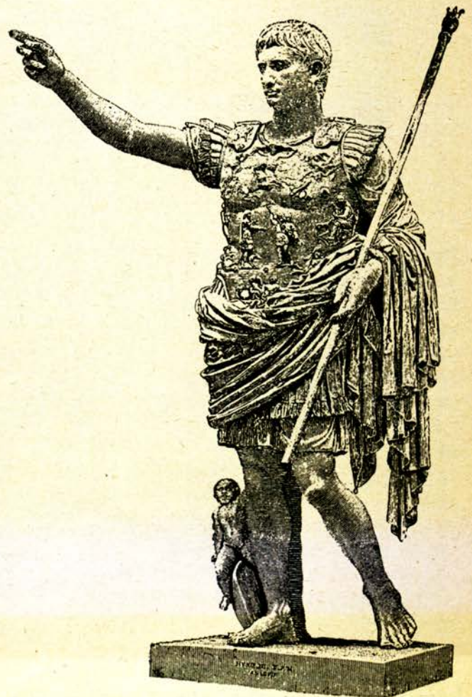
Статуя на императоръ Августа