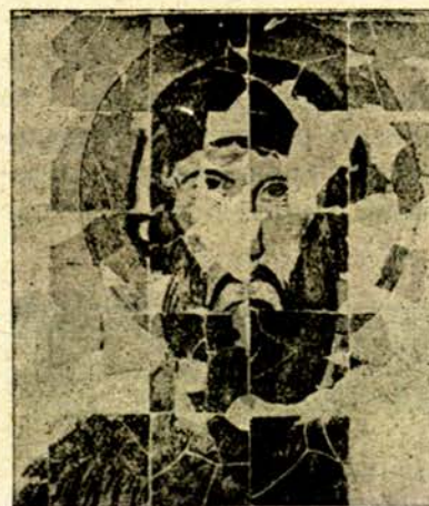
Керамиченъ образъ на св. Теодора, намѣренъ въ Патлейна

На плочки отъ печена бѣла глина сж били изобразени съ багри ликове на светии и различни украшения — цвѣтя и фигурки. Изработени сж били сжщо тѣй хубави керамични сждове и пѣстри иконки. Имало е богата мозаична украса по своדותѣ на църквитѣ и