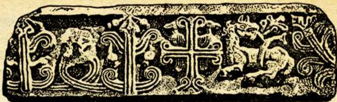
Отломка отъ мраморна плоча съ чудовище, кръстове и птици (отъ Стара-Загора)

Не бива да се чудимъ, че отъ онова, що създадо старото наше изкуство въ Симеоново време, до насъ е стигнало малко. Хиляда години ни дѣлятъ отъ тогава — години, минати въ войни, робство, разрушение.