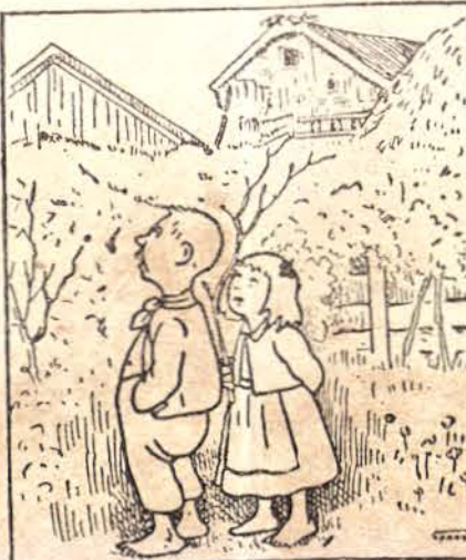
Тѣзи две деца търсятъ щъркела. Кжде е той?