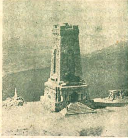
Паметникътъ на Свободата

така, че да си готовъ да жертвашъ живота си за нея, то значи да носиш въ сърцето си истинска любовъ къмъ близки и родина. Такава любовъ сж носили въ сърдцата си Левски, Ботевъ и всички апостоли за свободата на нашата родина. Тѣ истински сж обичали своитѣ поробени братя, за свободата на които жертвуваха живота си.