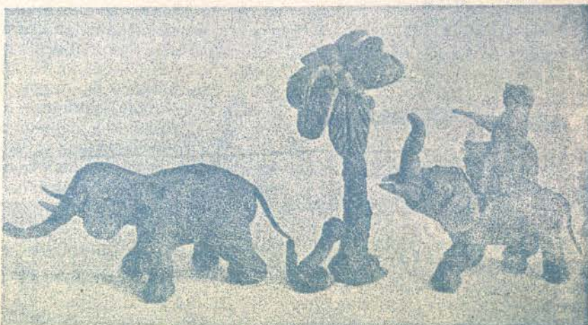
Изработете отъ пластелинъ тази фигурка!