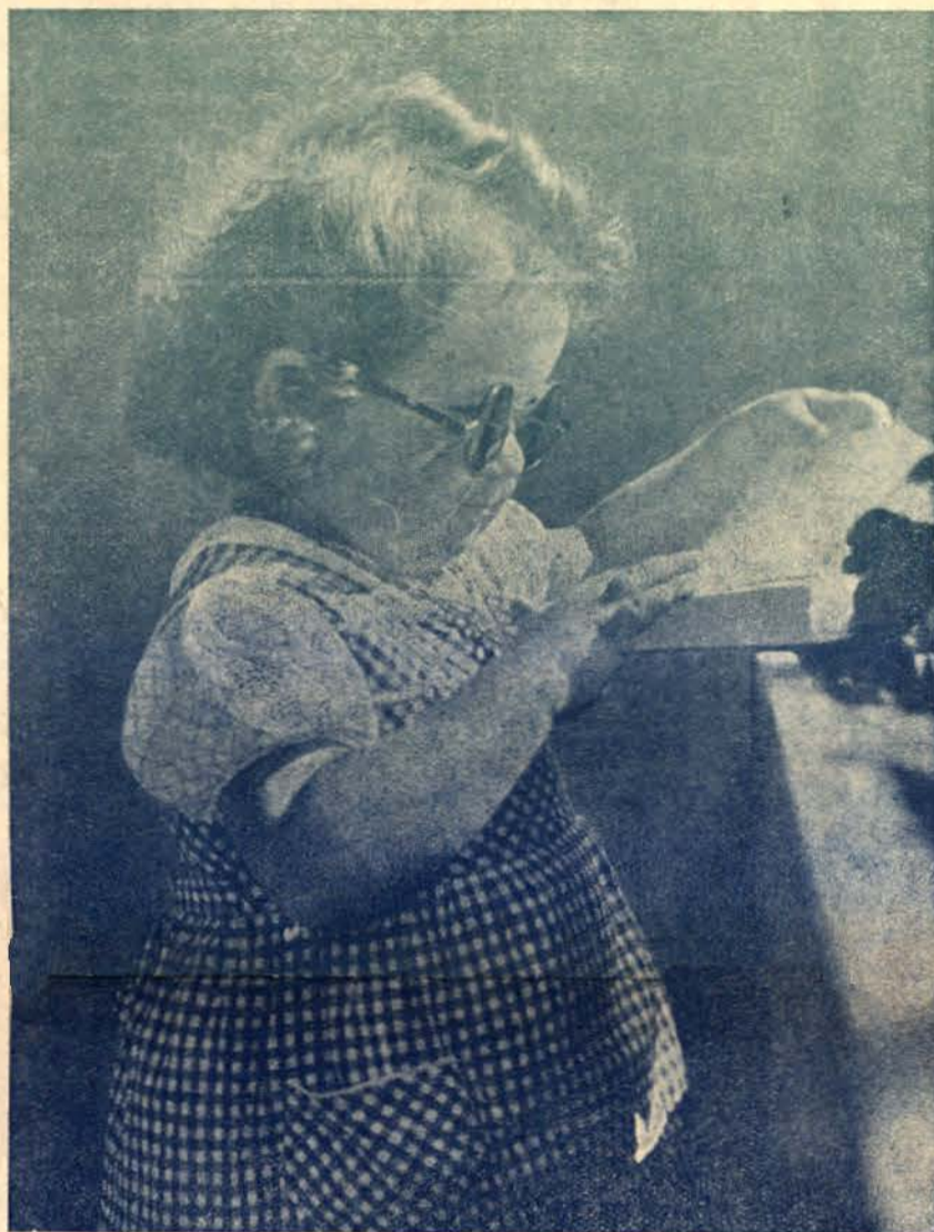
Азъ съмъ вече голѣма, имамъ очила, но буквитѣ чудни не мога да четат!