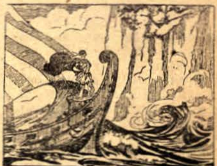
Одисей минава край острова на сиренитѣ.

Деветъ дни тихиятъ западенъ вѣтърь напжтваше нашитѣ корабни и бѣхме наближили вече островъ Итака, когато тежкъ сънъ ме обори и азъ заспахъ. Деветъ нощи бѣхъ будень и направлявахъ корабитѣ, но на десетата силитѣ ме напустнаха и приклонихъ глава на леглото. Тогава моитѣ другари, като смѣтаха, че мѣхътъ, който ми даде царъ Боля, е пълень съ злато и сребро, развързавъ го, за да си подѣлятъ скритото богатство. Щомъ като го отворили, вѣтроветѣ веднага изкочиха и страшна буря ни отнесе далече по безкрайнитѣ морски води. И пакъ трѣгнахме по непознати пжтища, да търсимъ помощъ и закрила.