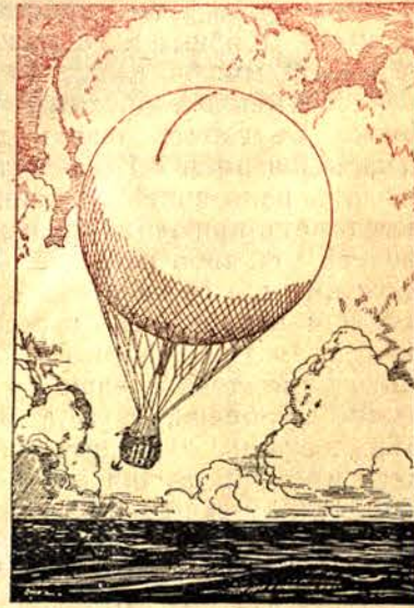
Единъ балонъ пада

Веднага мѣжетъ се заловиха да изхвърлятъ пушкитъ, храната, паритъ си и всичко каквото имаха.