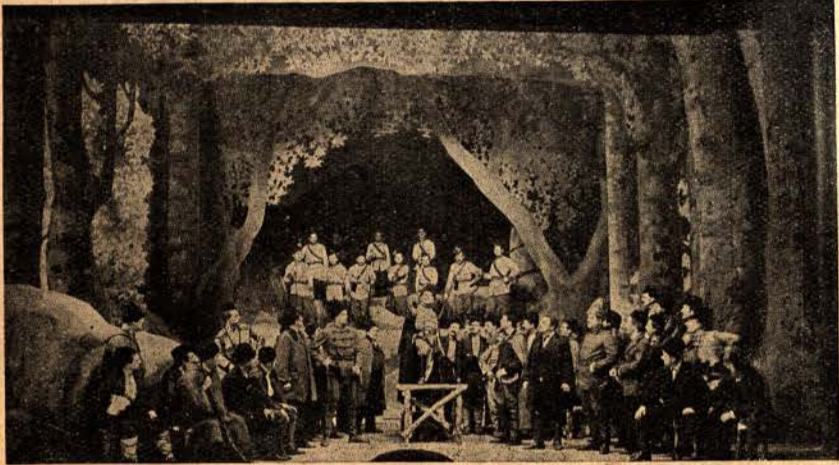
Войводата Бенковски говори предъ Великото народно събрание на Оборище.

Да кажа нѣколко думи и за изкуствената декорация на Оборище, или по-добре зала-