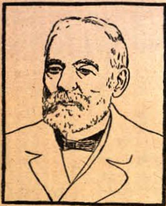
Христо Г. Дановъ

Патриархътъ на българското книгоиздаване