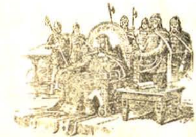
Като видѣ войницитѣ си Царь Самуилъ жадно наведе глава...