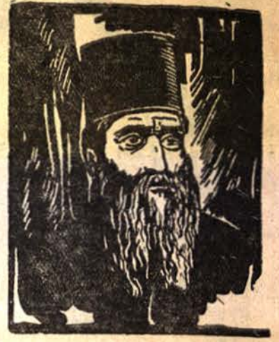
Неофитъ Бозвели 1785—1848

Неофитъ Бозвели е родомъ отъ гр. Котелъ. Откакъ получилъ основно образование при попъ Стойко (после епископъ Софроний), станалъ калугеръ въ Хилендарския манастиръ. Презъ 1813 г. той отишелъ като учителъ въ гр. Свищовъ и тукъ съставилъ своето Демоводство (шестъ книжки за основнитѣ училища). После, като видѣлъ злоупотрѣбитѣ на грѣцкитѣ владици, почналъ да подтиква българитѣ да си искатъ свое народно духовенство и българска, а не грѣцка, служба въ черквитѣ. Гърцитѣ го преследвали жестоко, а патриаршията го заточила два пѣти на Света-гора, гдето 8 години страдалъ въ голѣми неволи. До последенъ дѣхъ той училъ чрезъ писма буднитѣ българци да се борятъ за духовната си свобода. Написалъ е знаменитата Мати Болгария (1846 г.), гдето бичува грѣцкитѣ насилния и зове българитѣ къмъ просвѣта и защита на народната честь.