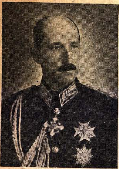
ЦАРЬ БОРИСЪ III

Цѣлиятъ български народъ — отъ Дунавъ до Егея и отъ Черно море до Охрида синь — тѣгува и още дълги години ще тѣгува за своя незабравимъ и обиченъ Царь, който ни остави да скѣрбимъ по преждевременната му и неочаквана кончина. Сега тленнитѣ му останки почиватъ смиренно въ олтаря на Светата Рилска обителъ, редомъ съ тленнитѣ останки на легендарния нашъ светецъ и закрилникъ — Свети Иванъ Рилски. Царь Борисъ III почитае много този нашъ светецъ и често отиваше да се моли въ храма на неговия манастиръ. Сега въ олтаря на сѣщия този храмъ до гроба на Свети Ивана е и неговиятъ прѣсенъ гробъ.