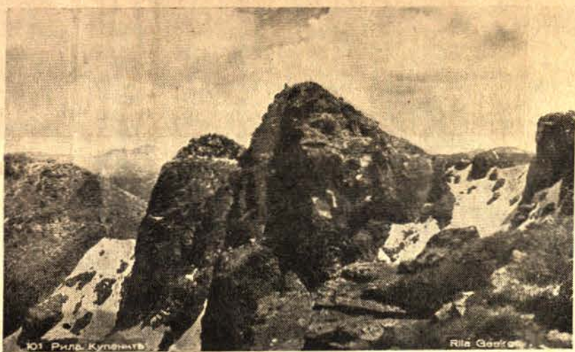
Вѣчно-снѣжнитѣ върхове на величествената Рила-планина

КРАЙНИЯТЪ СРОКЪ за изплащане абонамента съ право на безплатната книжка-премия „Царьтъ на златната рѣка“ изтича на 15 декемврий. Този срокъ нѣма да бѣде продължаванъ. Молимъ всички наши абонати и настоятели, които още не сѣ издължили да сторятъ това веднага, за да получатъ книжката-премия. Приложени къмъ този брой изпращаме ВНОСНИ БЕЛЕЖКИ за евтино и бързо изпращане на дължимитѣ суми.