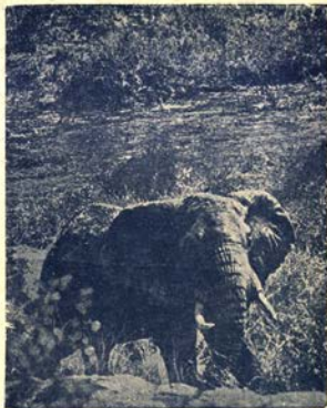
Старъ слонъ отива да се къпне

Миналата година, обаче, Зоологическата Градина въ София, въ която отъ 3 г. бѣха до-