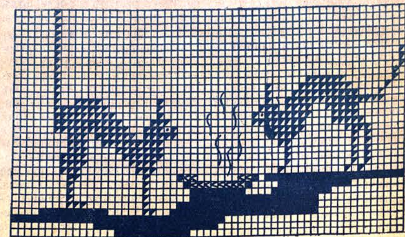
Увеличениятъ моделъ, по който се работи възглавничката

Тукъ даваме леко за работа моделче на една красива възглавница. Работи се върху зебло или етаминъ съ вълнени конци. Може да се използватъ разни изостанали прежди. Котенцата може да се направятъ шаренки, а очичкитѣ имъ зелени, изобщо — всѣко дете може да избере цвѣтове, като се посветва съ майка си или учителката си. Размѣрѣтъ на възглавницата е 40/60 см.