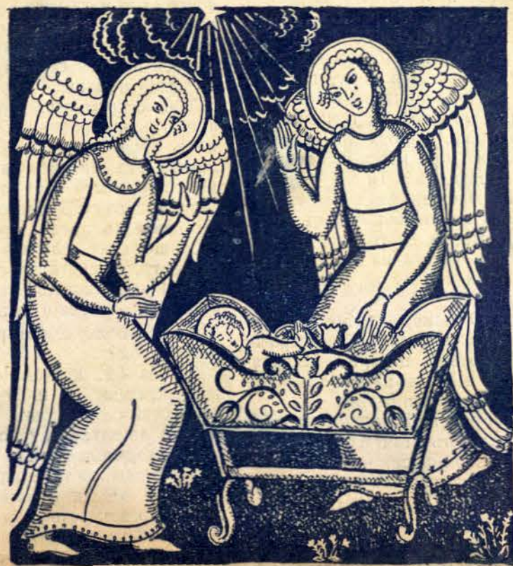
Картина отъ М. Иосифова

Пѣй, девойче, изъ полето, тая вечеръ на небето блѣсна нова лѣчезария, огнена звезда сияйна. Тя огрѣ поля, кошари, спрѣ надъ кжшицитѣ стари, прѣсна свѣтлина въ очитѣ, стопли съ блѣсъкъ чистѣ душитѣ