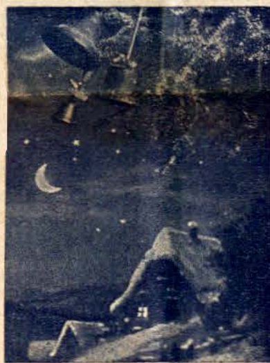
Блажени чиститѣ по сърдце, защото тѣ ще видятъ Бога. Иисусъ